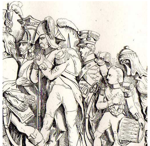
Relieves del Panteón de París.