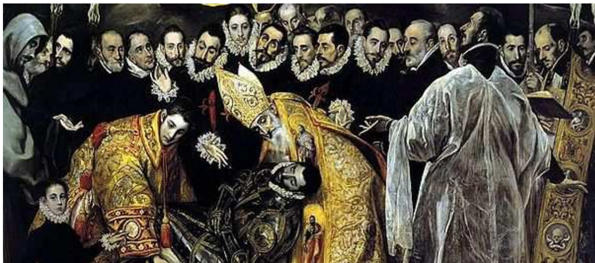
El Entierro del Conde Orgaz. Arriba registro superior. Abajo registro inferior