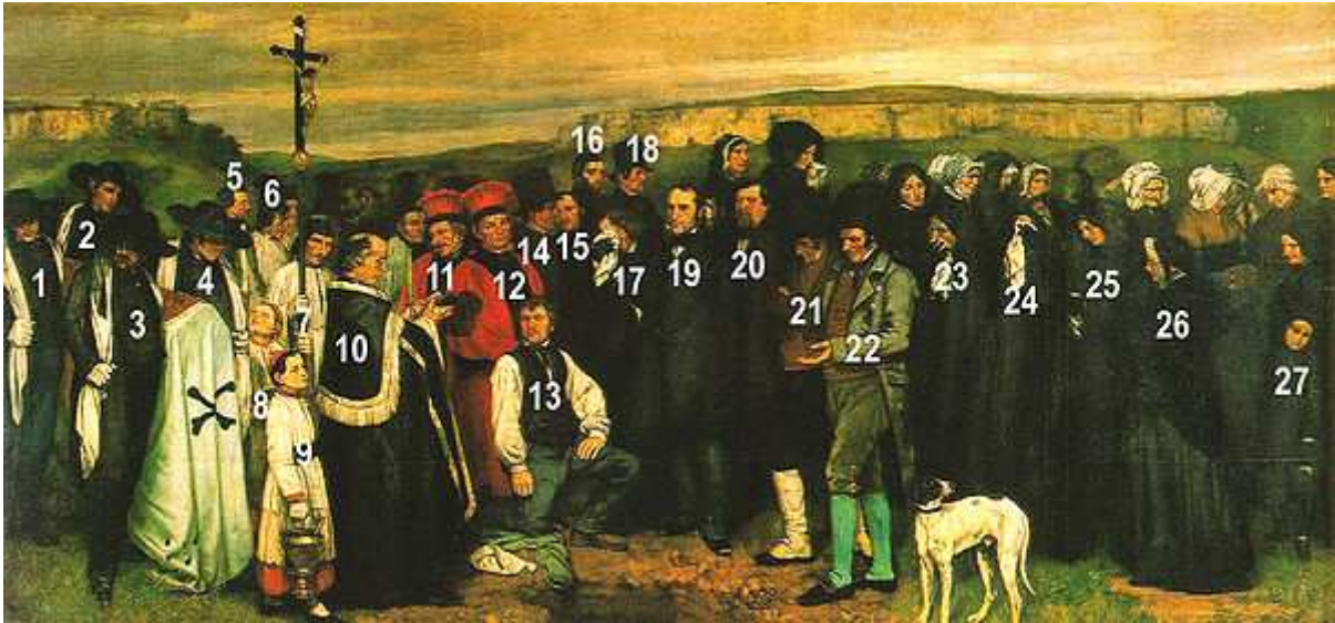
El Entierro de Ornas. Courbet. 1849. Estilo Pintura Realista